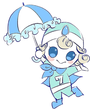
環七公式キャラクター ななこちゃん